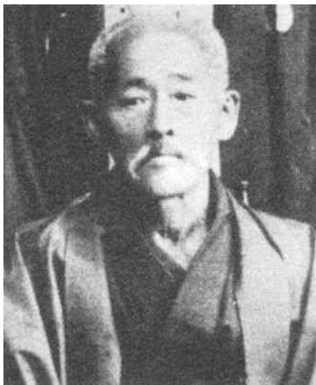
Kanryo Higaonna (1853/1915)

claras que apunten o dejen de apuntar a ello. Con la reseña histórica de antes y usando un sencillo análisis comparativo de los kata, podemos hacer algunas deducciones.