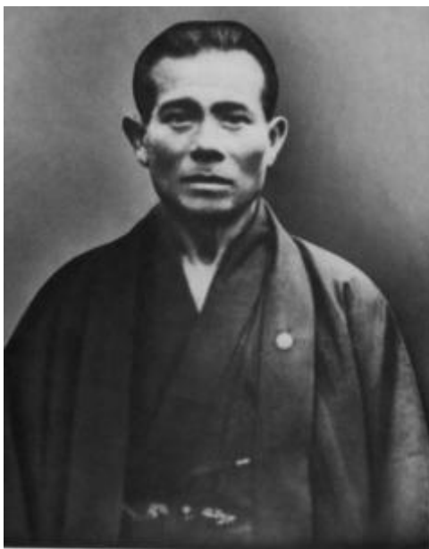
Kanbun Uechi (1877/1948)

Los nombres de los kata no son la única similitud. El Sanchin de Uechi ryû, aunque se ejecuta con las manos abiertas, recuerda mucho a la versión de Higaonna. De hecho, la tradición afirma que Higaonna enseñaba Sanchin originalmente con las manos abiertas.