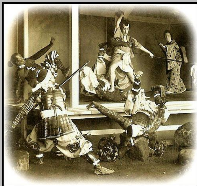
Composición de Nobukuni Emani. Fotografía siglo XIX.

Al narrar esta historia, mi instructor no se concentró en los detalles de la lucha, ciertamente, en la historia no había nada de especial interés, ni siquiera algún detalle digno de ser mencionado. A pesar de todo, me preguntó: ¿Cómo supones que se sintió Yagyu Sensei la noche antes del duelo? Esta pregunta bien podría haberse aplicado a cualquiera de los espadachines de aquellos días, guerreros que exponían constantemente su vida y honor (lo que para ellos era aún más importante) al elegir el arte de la espada como Camino, o Vía para sus propias existencias.