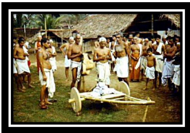
Nambudiris de Kerala

Algunos Indólogos afirman que tales desplazamientos comenzarían a principios de nuestra Era –siglos II y III- y que esto quedaría atestiguado considerando los textos literarios del Período Sangam -siglos III a. C. al III d. C.- en los que se informa de esta circunstancia. En oposición a estas tesis otros expertos defienden que aquellos movimientos humanos se retrasarían hasta los siglos V al VII, una vez desaparecidos los primeros reinos de la dinastía dravidiana de los Chera.